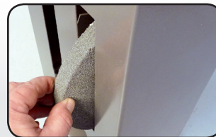
Range meules intégré Wheels holder