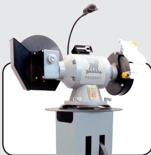
Exemple de montage de touret Bench grinder mounting example