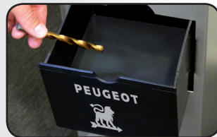
Tiroir à liquide Drawer for liquid