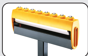
Tête basculante Tilting head