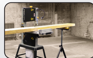
Idéal grandes longueurs Ideal large lengths