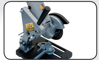
ø 115 - 125 mm