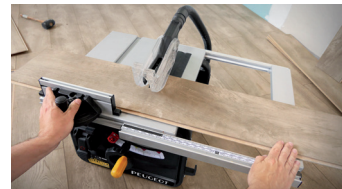
Extension de table rétractable Retractable table extension