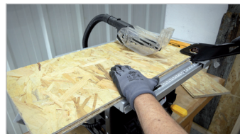
Carter de lame transparent Transparent blade guard