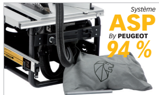
Sac collecteur de poussières intégré (14L) Integrated dust suction (14L)