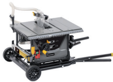
Table: 455x605/800 mm

Piante : transport facile Foldable : easy transportation