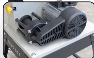
Système d'aspiration cyclonique intégré Dust wizard inside