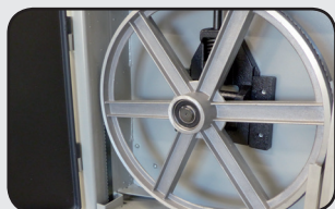
2 Volants fonte d'aluminium 305 mm 2x 305 mm cast aluminium wheels