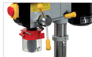
Commandes droitier ou gaucher Right or left hand system