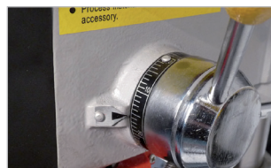
Butée de profondeur Depth gauge