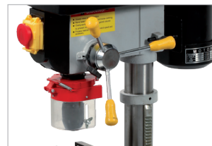
Cabestan droitier ou gaucher Right or left hand system