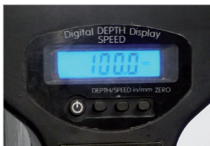
Affichage numérique vitesse / profondeur Speed / depth digital screen