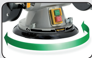
Base pivotante 180° 180° twisting base