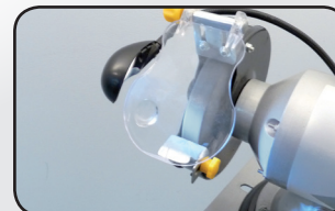
Éclairage LED orientable Adjustable LED light