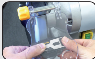
Dressoir incorporé Wheel dresser