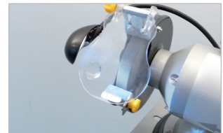
Éclairage LED orientable Adjustable LED light