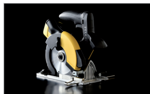
Plateau alu. inclinable à 45° 45° reclining aluminium tray