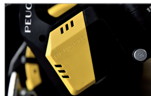
Technologie Brushless Brushless technology