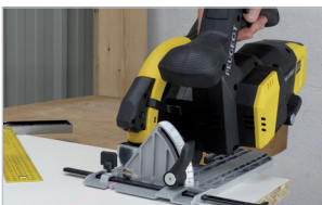
Moteur BRUSHLESS BRUSHLESS motor